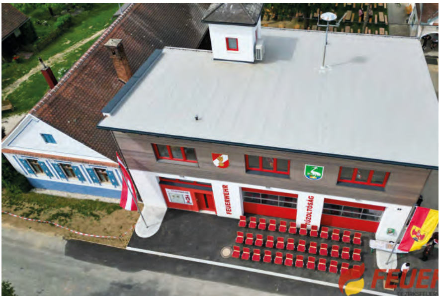
A tűzoltóság épülete az átépítés és felújítás után 2025-ben Das Gebäude der Feuerwehr nach dem Umbau und der Renovierung, 2025