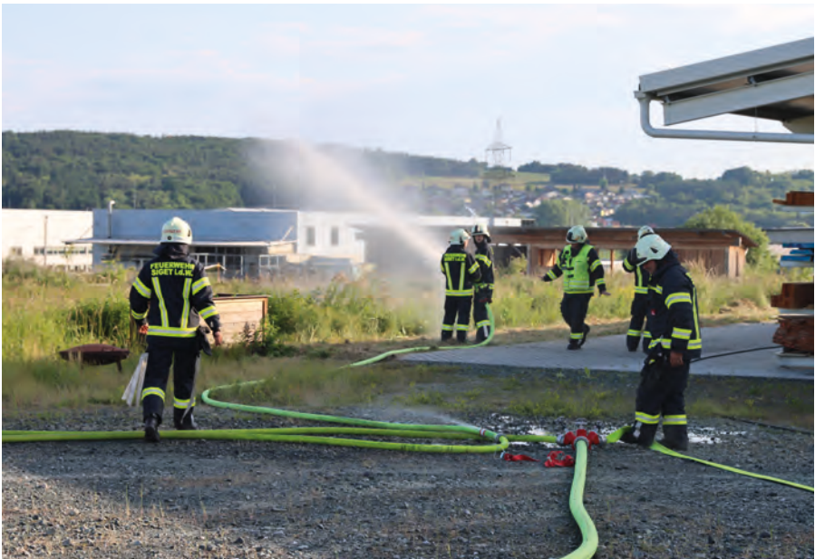
Éves gyakorlat Óriszigetben 2025-ben Inspizierungsübung in Siget in der Wart, 2025