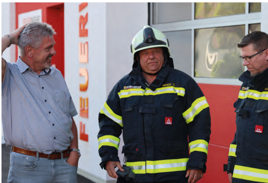
Éves gyakorlat Óriszigetben 2025-ben Inspizierungsübung in Siget in der Wart, 2025