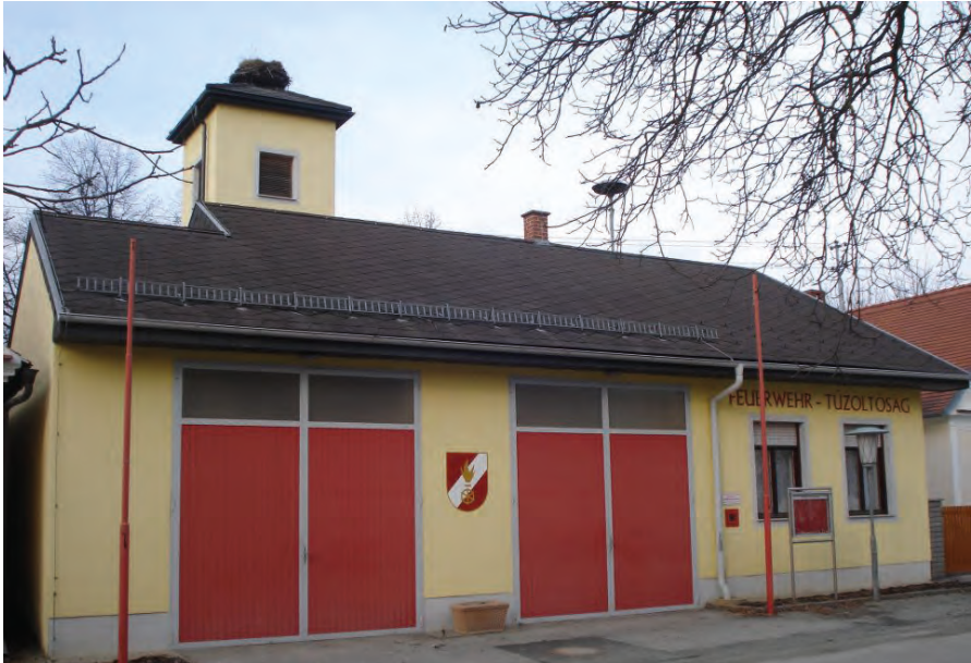
A tűzoltóság épülete az átalakítás előtt, 2011 Das Gebäude der Feuerwehr vor dem Umbau, 2011