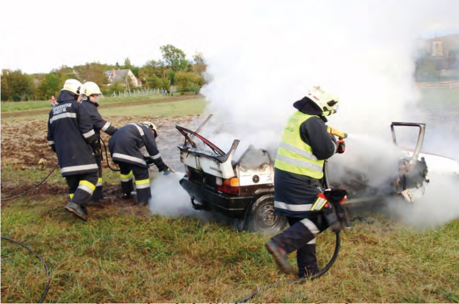
Katasztrófa gyakorlat 2011-ben Kőszegen és Bozsokon Katastrophenübung Feuerwehren Kőszeg/Bozsok, 2011