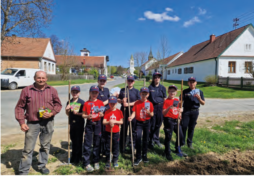
"BeeWild" 2025 - a tűzoltóság fiataljainak hete BeeWild Feuerwehrjugend-Woche, 2025