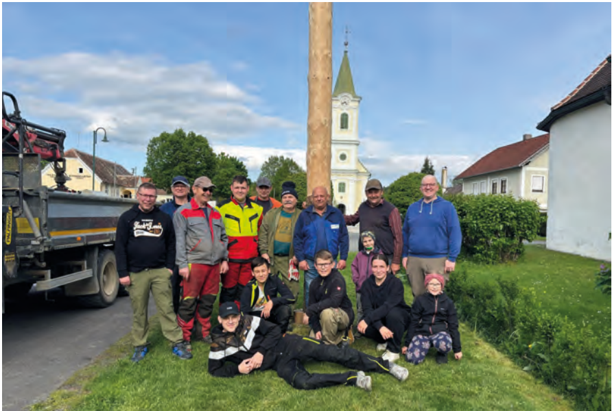
Májusfa állítás 2025 Maibaum aufstellen, 2025