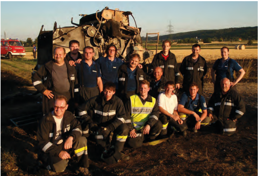
Tarlótűz 2013-ban Flurbrand, 2013