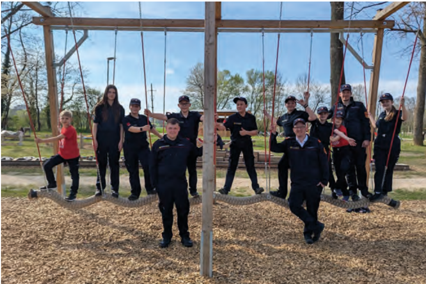
A fiatalság a sikeres vizsga után 2025-ben Wissenstest 2025 ist geschlagen