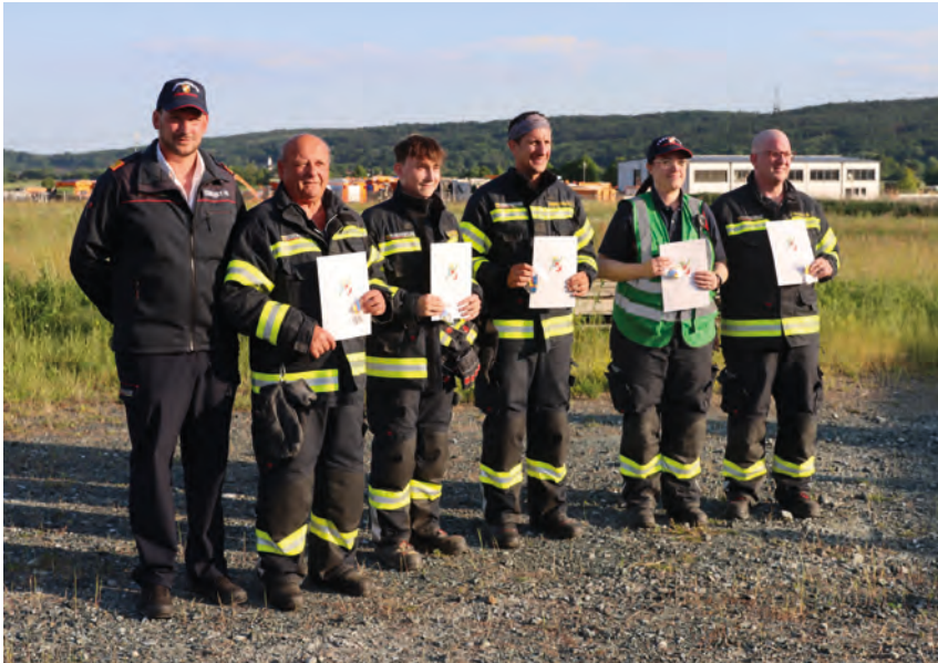
Kitüntetések: Alsó-Ausztria katasztrófaelhárítási érme (2024 Würrmla, árvíz-katasztrófa) Auszeichnung: Katastrophenschutzmedaille des Landes Niederösterreich (2024 Würrmla, Hochwasserkatastrophe)