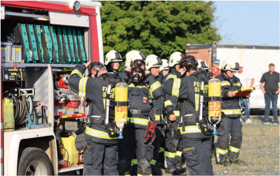
Éves gyakorlat Óriszigetben 2025-ben Inspizierungsübung in Siget in der Wart, 2025