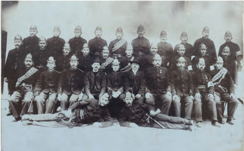
Az alapítók Gründungsmitglieder