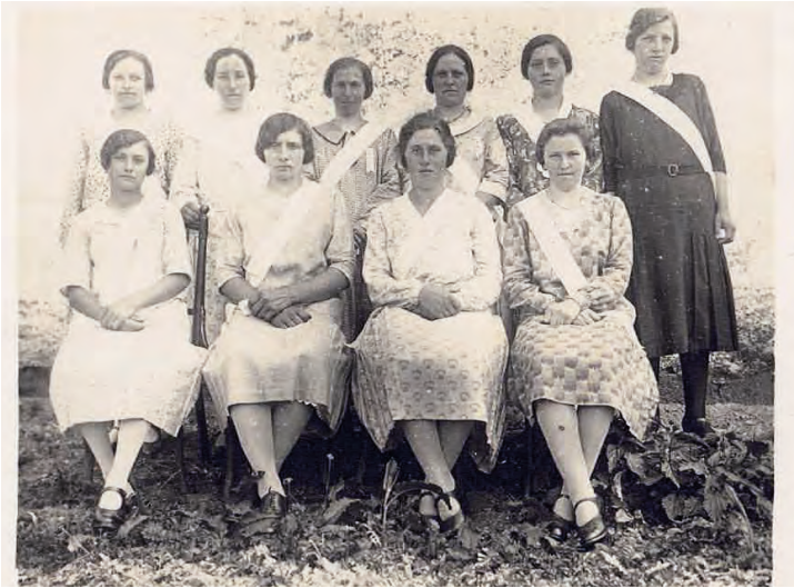
25 éves jubileumi ünnepség 25-jähriges Jubiläum