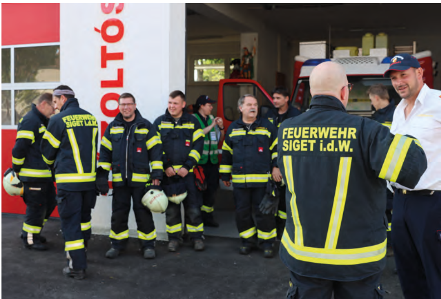
Éves gyakorlat Óriszigetben 2025-ben Inspizierungsübung in Siget in der Wart, 2025