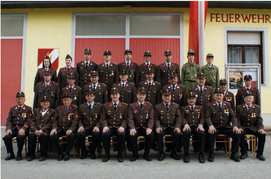
Csoportfotó 2011-ből Gruppenfoto, 2011