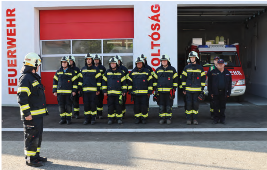
Éves gyakorlat Óriszigetben 2025-ben Inspizierungsübung in Siget in der Wart, 2025